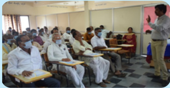
ರಾಯಚೂರು ಜಿಲ್ಲೆಯ ಲಿಂಗಸುಗೂರು ತಾಲ್ಲೂಕಿನ ನಬಾರ್ಡ್ ಪ್ರೋತ್ಸಾಹಿತ ರೈತ ಉತ್ಪಾದಕರ ಸಂಸ್ಥೆಗಳ ಪದಾಧಿಕಾರಿಗಳಿಗೆ ತರಬೇತಿ ಮತ್ತು ಸಾಮರ್ಥ್ಯ ಬಲವರ್ಧನೆ ಕಾರ್ಯಕ್ರಮ. ದಿನಾಂಕ 15-16 ಡಿಸೆಂಬರ್ 2021, ಸ್ಥಳ: ಕೃಷಿ ವಿಸ್ತರಣಾ ಶಿಕ್ಷಣ ಘಟಕ, ಲಿಂಗಸುಗೂರು