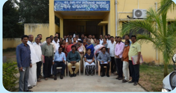
ರಾಯಚೂರು ಜಿಲ್ಲೆಯ ಸಿಂಧನೂರು ತಾಲ್ಲೂಕಿನ ನಬಾರ್ಡ್ ಪ್ರೋತ್ಸಾಹಿತ ರೈತ ಉತ್ಪಾದಕರ ಸಂಸ್ಥೆಗಳ ಪದಾಧಿಕಾರಿಗಳಿಗೆ ತರಬೇತಿ ಮತ್ತು ಸಾಮರ್ಥ್ಯ ಬಲವರ್ಧನೆ ಕಾರ್ಯಕ್ರಮ. ದಿನಾಂಕ 17-18 ಡಿಸೆಂಬರ್ 2021, ಸ್ಥಳ: ಕೃಷಿ ವಿಸ್ತರಣಾ ಶಿಕ್ಷಣ ಘಟಕ, ಲಿಂಗಸುಗೂರು