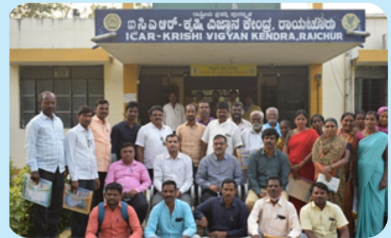
ರಾಯಚೂರು ಜಿಲ್ಲೆಯ ರಾಯಚೂರು ಮತ್ತು ದೇವದುರ್ಗ ತಾಲ್ಲೂಕುಗಳ ನಬಾರ್ಡ್ ಪ್ರೋತ್ಸಾಹಿತ ರೈತ ಉತ್ಪಾದಕರ ಸಂಸ್ಥೆಗಳ ಪದಾಧಿಕಾರಿಗಳಿಗೆ ತರಬೇತಿ ಮತ್ತು ಸಾಮರ್ಥ್ಯ ಬಲವರ್ಧನೆ ಕಾರ್ಯಕ್ರಮ. ದಿನಾಂಕ 20-21 ಡಿಸೆಂಬರ್ 2021, ಸ್ಥಳ: ಕೃಷಿ ವಿಜ್ಞಾನ ಕೇಂದ್ರ, ರಾಯಚೂರು